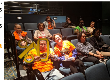
Audiencia Pública del Bronx

Gracias al testimonio de CASA y otros grupos de inquilinos por toda la ciudad, la RGB votó a favor de un aumento de 1.5% para contratos de arrendamiento de 1 año y un aumento de 2.5% para contratos de 2 años.