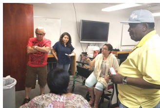
Intercambio con Brooklyn

feria de recursos! El derecho a la representación legal crea una oportunidad para resistir antes los casos y tomar acciones valientes, como huelgas de alquiler o casos 7A, ¡a sabiendas de que contaremos con el apoyo de abogados! Esta ley entrará en pleno vigor en el año 2022. En mayo, los miembros de la campaña de la corte de vivienda se reunieron con inquilinos de Brooklyn, quienes también llevan años