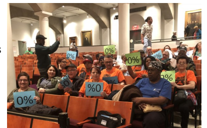
Voto preliminar del RGB

Comuníquese con Yeraldi 718-716-8000 ext 117 o y.perez@newsettlement.org para involucrarse!